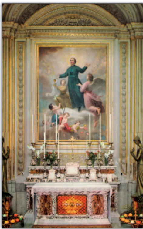
In Albano Laziale ogni giorno preghiamo per voi

Facendolo sosterrai anche le nostre missioni, grazie!