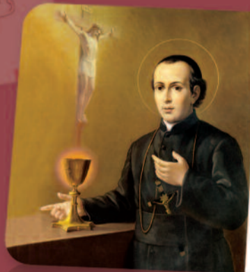
S. GASPARE DEL BUFALO FONDATORE DEI MISSIONARI DEL PREZ.MO SANGUE "Egli vi proteggerà ovunque"

Facendolo sosterrai anche le nostre missioni, grazie!